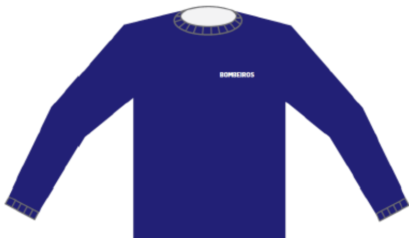
Figura 5: Camisola – frente