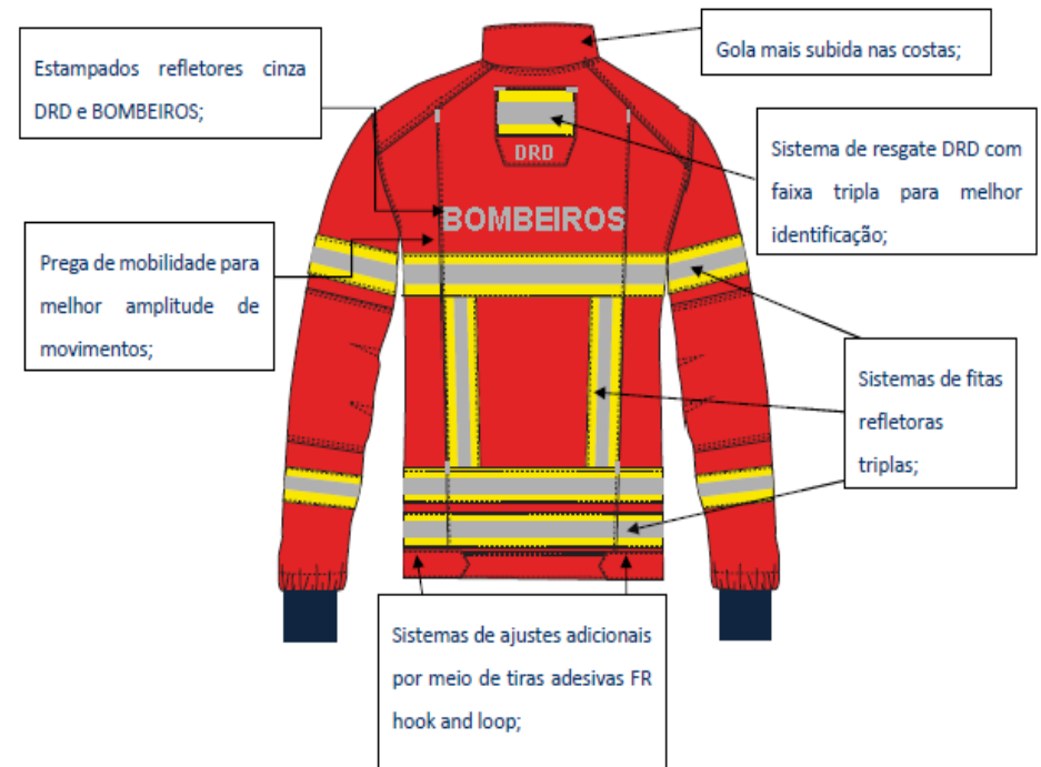
Figura 2: Casaco – tardoz