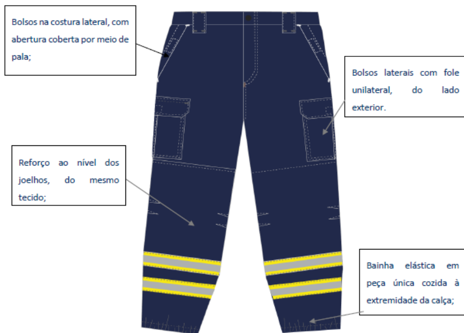
Figura 3: Calça – frente