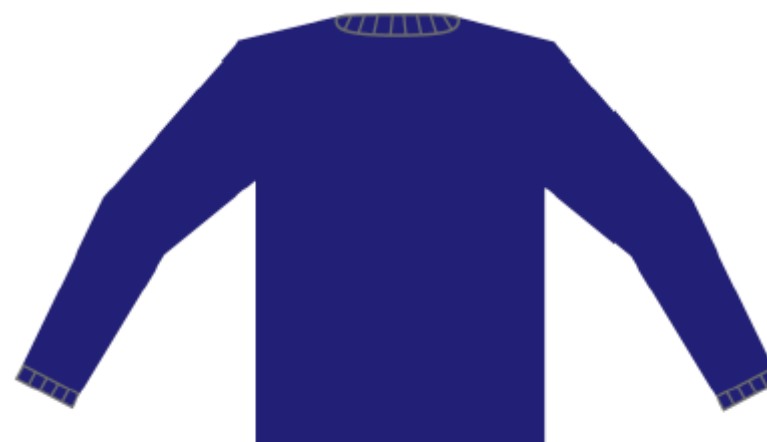
Figura 6: Camisola – tardoz