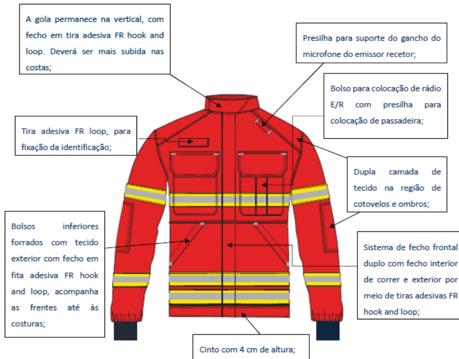
Figura 1: Casaco – frente